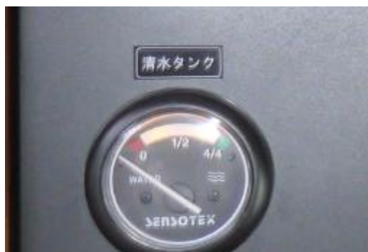
清水タンクゲージ